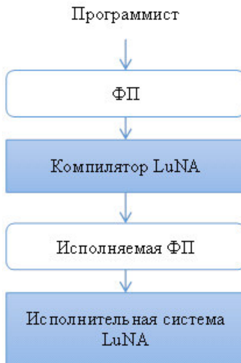
Рисунок 1 – Общая структура системы LuNA (ФП - фрагментированная программа)

как независимые и взаимодействующие процессы. Исполнение алгоритма автоматически осуществляет Система LuNA. Она размещает фрагменты данных в распределенной памяти мультикомпьютера, отслеживает информационные зависимости между фрагментами вычислений и исполняет последние. Исполнение фрагмента вычислений состоит в том, что ему назначается вычислительный узел, в локальную память этого узла передаются все входные фрагменты данных для этого фрагмента вычислений (если они уже не находятся там), и запускается последовательная процедура над этими фрагментами данных. Результатом выполнения процедуры является набор значений выходных фрагментов данных, которые используются системой далее для выполнения следующих фрагментов вычислений.